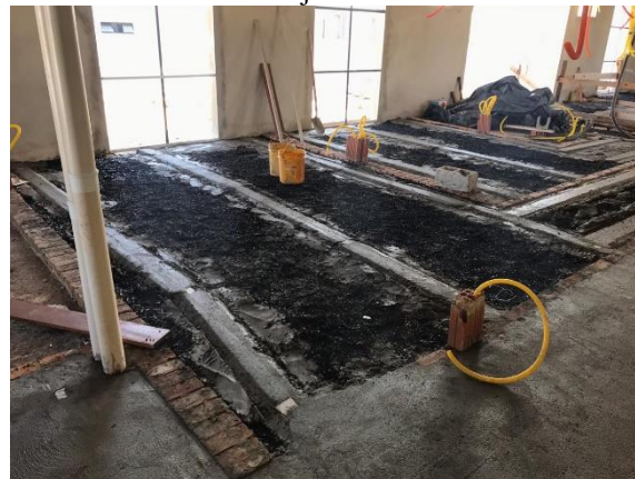
Figura 3 – Nivelamento de laje com resíduos de carvão vegetal.

Na construção civil, o carvão vegetal pode ser usado no enchimento e nivelamento de lajes de piso (Figura 3). Por ser um material leve, atende aos requisitos construtivos de execução sem agregar peso a estrutura.