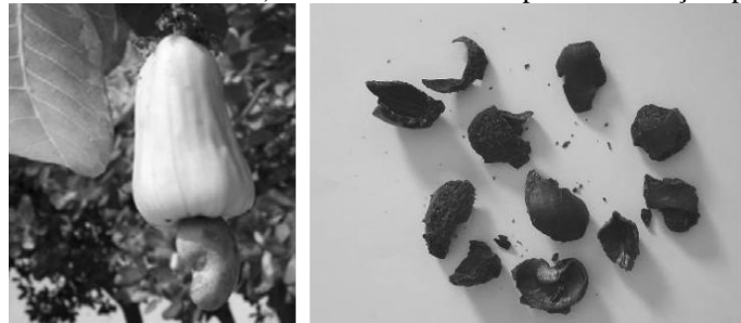
Figura 1 – a) Caju: pedúnculo e castanha. b) Cascas de castanha após decorticação: pedaços não-uniformes.