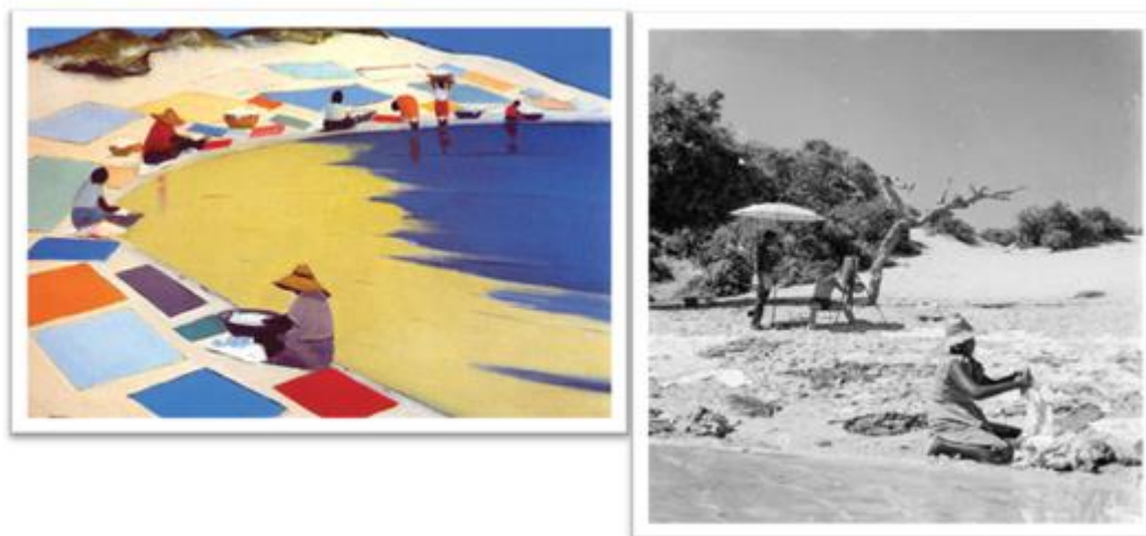
Figura 5: Pintura de Pancetti da Lagoa do Abaeté, anos 50-60 (à esq.) e fotografia de Pierre Verger de Pancetti e lavadeiras as margens da Lagoa do Abaeté, em 1957 (à dir.).

Desse modo, a lavagem de roupa nas margens da Lagoa do Abaeté, bem como o comércio de produtos na região da praia de Itapuã, passam a ser marcos da cultura local do bairro, bem como da cidade de Salvador. Portanto, tais ofícios acabam por consolidar trajetórias ancestrais que vão ser reafirmadas a partir das infraestruturas provenientes da expansão urbana mas sob a perspectiva do apagamento dos enraizamentos nativos e afrodescendentes pré-existentes nesses territórios de borda continental à serem cobiçados pelo recente capital do turismo, considerados não civilizados até o advento da implementação do plano idealizado por Mário Leal Ferreira com o EPUCS e consequente expansão urbana para o litoral norte da cidade nos anos 80, durante o Carlismo e ditadura militar (SCHEINOWITZ, 1998).