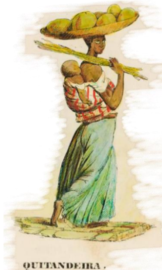
Figura 2: Escrava de Ganho (DEBRET. 1835).

fazendo uso sistemático do gelo para sua conservação. Antes disto era preciso moquear o pescado comercializado a distância, e essa era uma tarefa essencialmente feminina, segundo os costumes locais.